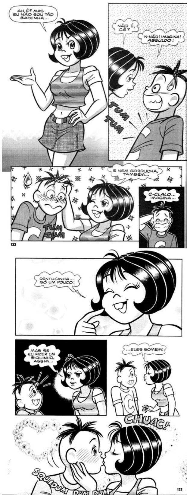
(Turma da Mônica Jovem. ed. 4, novembro/2008, p. 122-123).